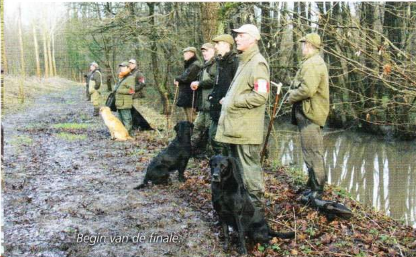
Begin van de finale.

zal men dat echter zelden zien gebeuren. Deze honden hebben bewezen dat ze fysisch en mentaal steady zijn, zo niet waren ze al lang uit het wedstrijdgebieden verdwenen. We merkten meteen dat de keurmeesters zeer nauwkeurig te werk gingen en dat ze naast het postgedrag ook oog hadden voor elk detail van het Retrieverwerk. Van een apporterende hond wordt verwacht dat hij eenmaal uitgestuurd in rechte lijn en zonder al te veel ondersteuning naar de vermoedelijke valplaats gebracht kan worden. In die omgeving dient hij een klein gebied aandachtig en zelfstandig uit te jagen. Als hij het gebied verlaat moet de voorjager in staat zijn om de hond met fluitsignalen, armgebaren en een enkel verbaal commando terug op de juiste plaats te krijgen en te houden. En hier knelt soms het schoentje. Wie