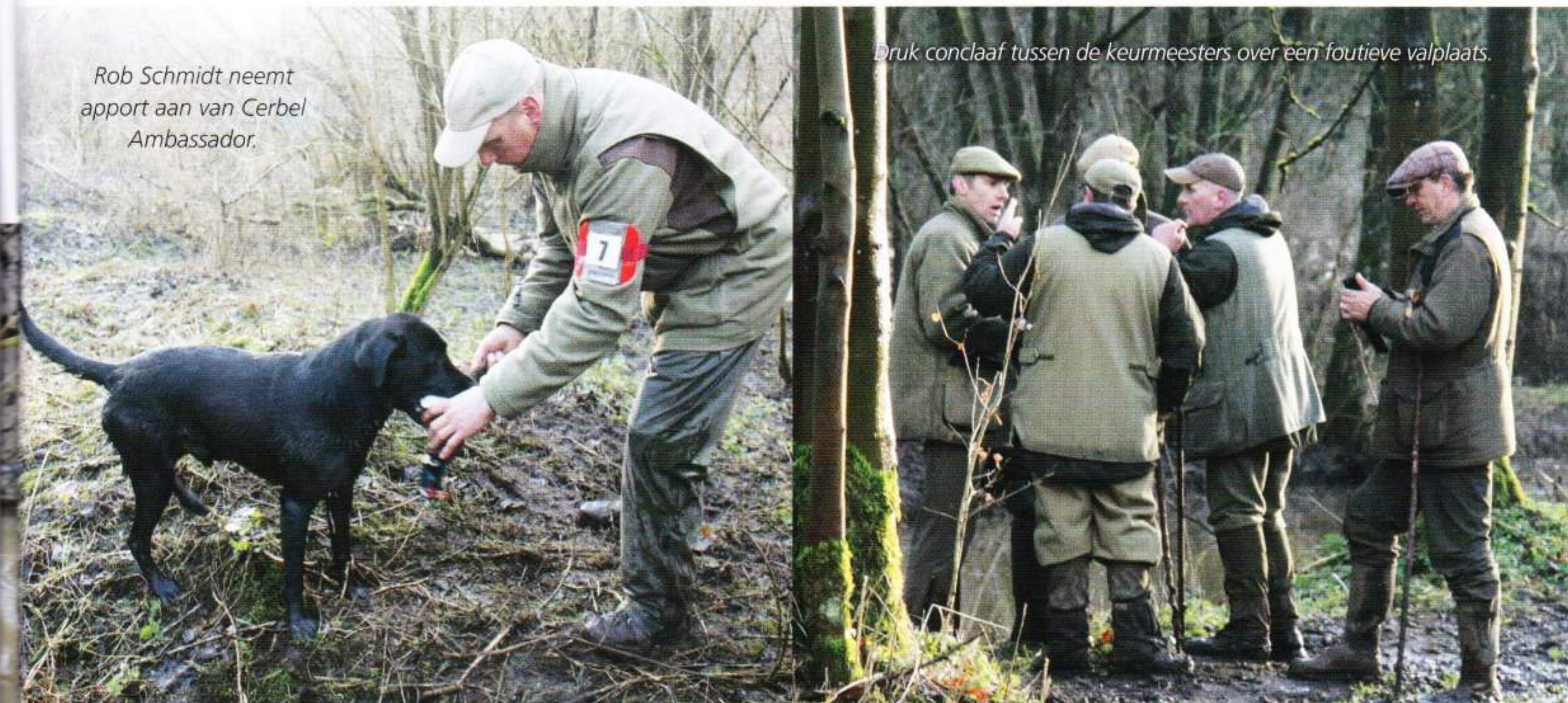
Druk conclaaf tussen de keurmeesters over een foutieve valplaats.