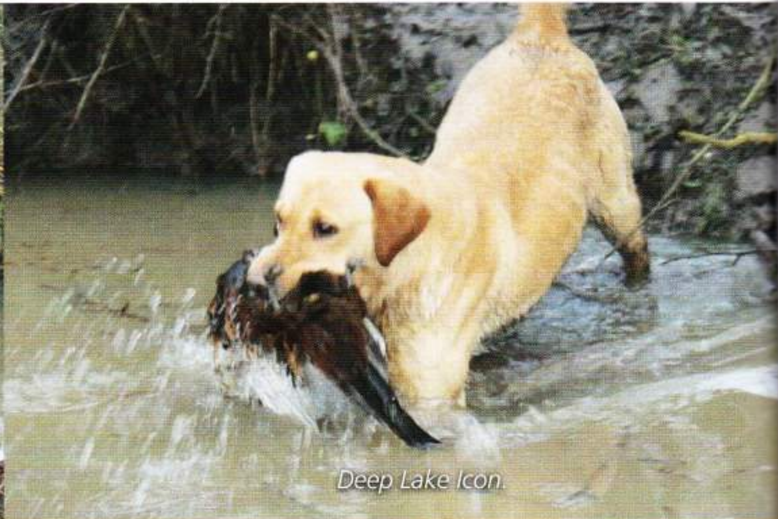
Deep Lake Icon.